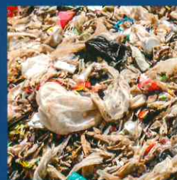
Ersatzbrennstoff / Pneus