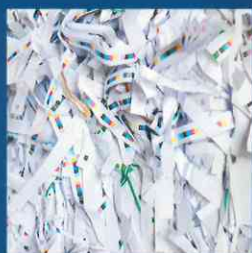
Altpapier / Karton