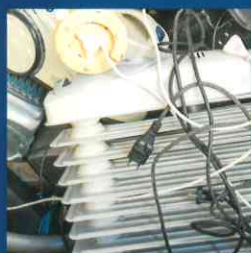
Batterien / Elektroschrott