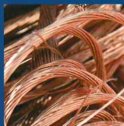
Eisen / Metalle