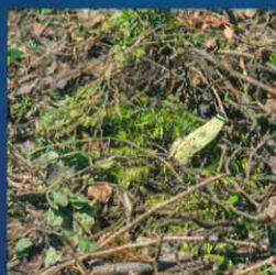
Grünabfall / Organische Abfälle